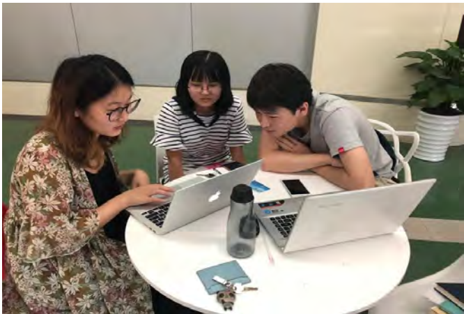
图 2 小组讨论

本文以 2013—2016 年 26 家传媒类上市公司为样本，在建立社会责任评价体系、引入创新中介变量、运用因子分析法评价财务绩效之后，采用结构方程模型，实证分析社会责任、创新与财务绩效关系。研究发现：（1）社会责任承担对长、短期财务绩效有不显著和负向影响；（2）创新对长、短期财务绩效有正向和负向影响；（3）社会责任承担通过创新对长、短期财务绩效有负向和正向的间接影响；（4）社会责任承担对长、短期财务绩效呈现负向的总影响。根据以上结论，小组提出了三点建议供政府与企业制定决策的过程中参考。最终，在实证分析的基础上，小组在重庆市范围内进行了对三家传媒企业进行了调研采访。